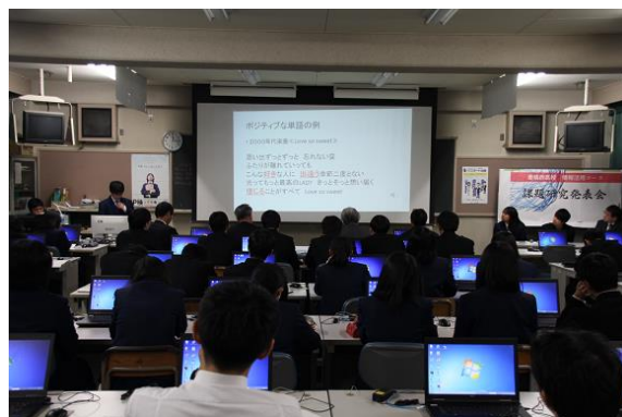
「年代と音楽の関係性」 についての発表