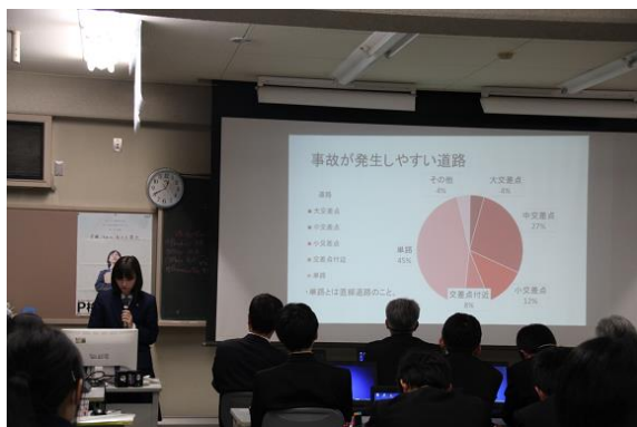
「愛知県の交通事故について」 についての発表