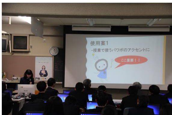
「情報活用コースのマスコットキャラ作成」 についての発表