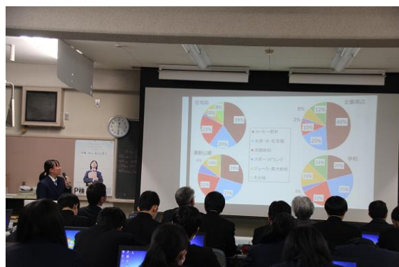
「自動販売機の工夫」 についての発表